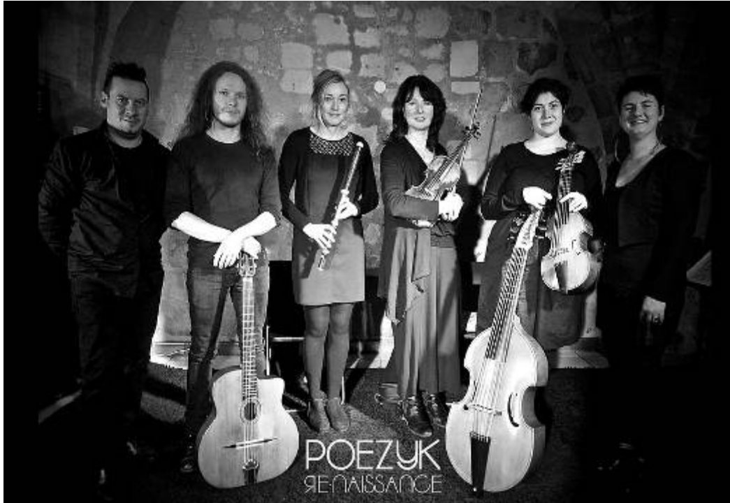
Poézyk Re-Naissance au Vinci à Tours, septembre 2018

PoéZYk – Re-Naissance – formation Voix/quatuor de musique ancienne (Violes, Violon, Traverso, Guitare)