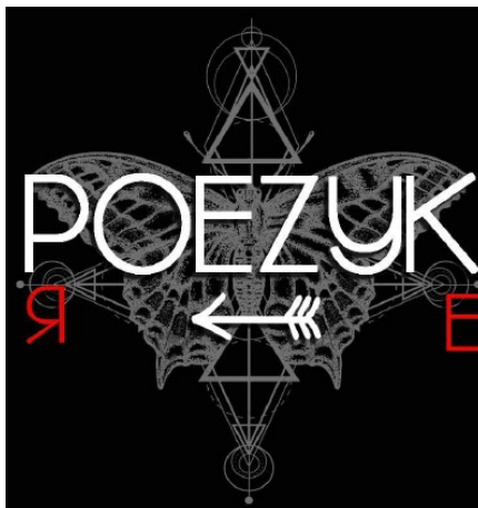
PoÉZYk Ombre et Lumière, à l'Alliance Française de Chicago en juin 2017