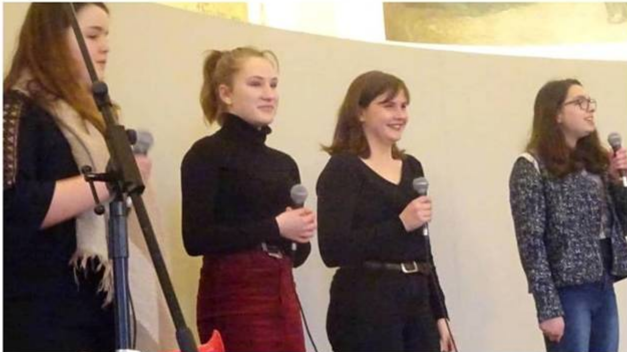
Quand les slameuses se mettent en quatre...