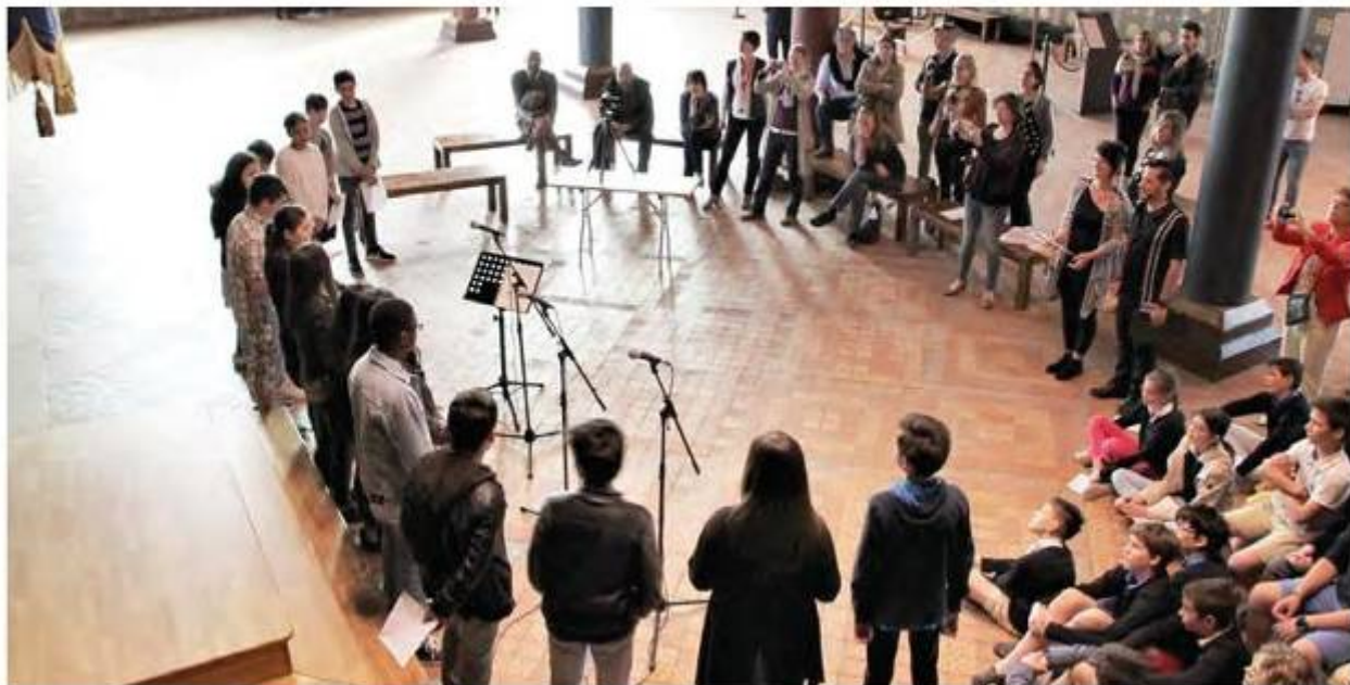
Les élèves de 4e des collèges de Sambin et Bégon ont déclamé leurs poèmes pendant toute une matinée dans la salle des Etats généraux du château de Blois.

Des collégiens de Sambin et de Bégon ont passé une matinée au château de Blois à déclamer des poèmes qu'ils ont écrit dans le cadre d'un projet intitulé « Muséoslam » mêlant histoire et art.