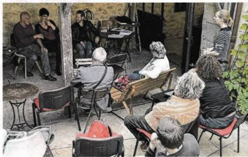
Les participants ont pu poser leurs questions aux slameurs américain et du Sud-Touraine.