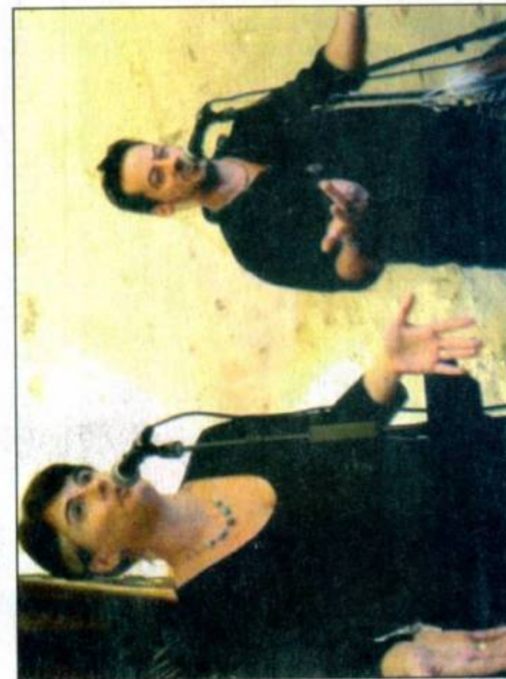
French Slam Poetry duet "Zurg and Yopo" will be among the featured performers at the "Slam Cabaret—Deux" event Saturday night, Oct. 21, at Henry's Double K in Mount Carroll. The Mount Carroll District Library benefit recreates last April's hugely successful poetry slam and open mic for local performers and guest artists from Chicago's Green Mill nightclub.