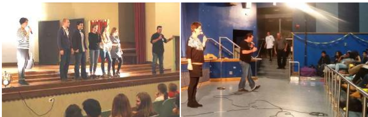
Au Lycée français – à L'EFAC et Lincoln Park HS, Chicago en 2016